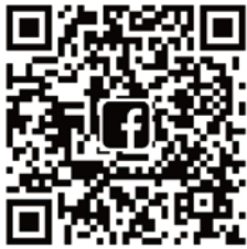
官方粉絲團 QR Code

如有任何疑問 請發問於本競賽之官方粉絲團， 或電洽萬能科技大學 時尚造型設計系 林禎唯老師 0958219992。